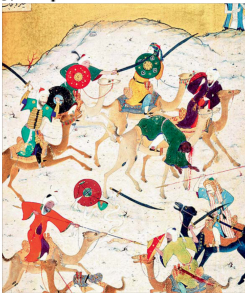
Miniature tirée de Kamasah, 1442, British Library, Londres.

Les successeurs de Mohammed se lancent dans des conquêtes, c'est le djihad. L'État musulman devient un empire