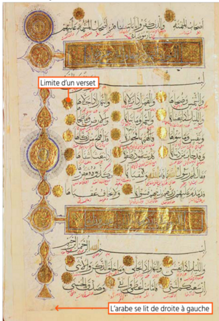
Vellum, XII e -XIII e siècle, Museum of the Holy Ma'sumeh Shrine, Qom, Iran.

Le Coran (« récitation » en arabe) est considéré comme la parole de Dieu, dictée par Allah à Mohammed. Le Coran a été écrit à la demande des premiers califes en langue arabe.