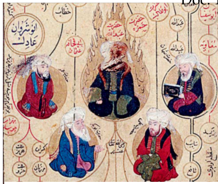
Miniature ottomane, XV e siècle, Bibliothèque nationale, Le Caire

Mohammed entouré de ses premiers successeurs (632-661), les califes Abou Bakr, Omar, Othman et Ali.