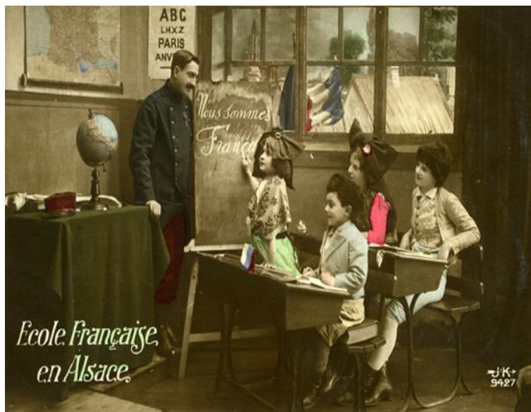
Carte postale colorisée, 1918.