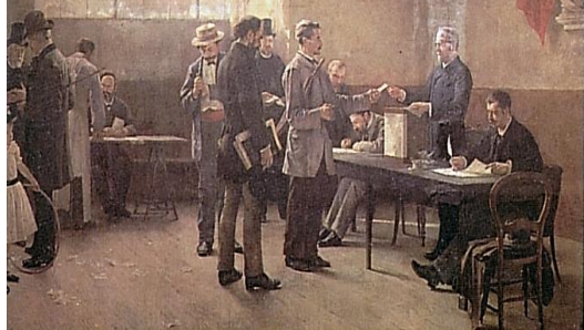
Le suffrage universel en 1891 d'après un tableau d'Alfred Bramtot