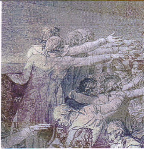
Un groupe de député prêtant serment. Détail du « Serment du Jeu de Paume » peint par J.-L. David.

L'artiste avait déjà représenté un serment en 1785 avec la toile « le Serment des Horaces ».